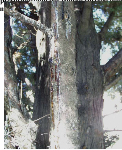
Fig. 4 – Exsudações de resina devido a cancro em Cupressus sempervirens .

tronco permite detectar a presença de cancos que apresentam fendilhamento longitudinal e uma abundante exsudação de resina, bem como uma coloração vermelho cardeal dos tecidos internos, quando se destaca a casca (Figs. 3 e 4).