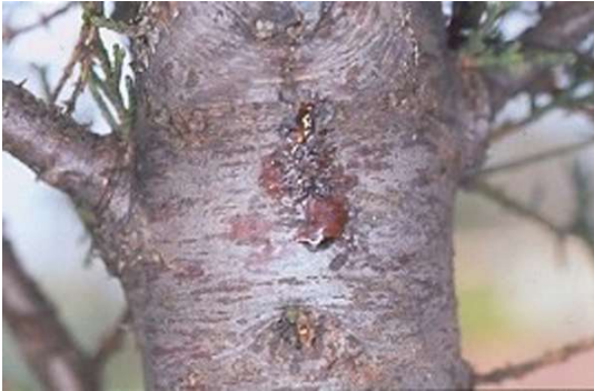
Fig. 9 - Escorrimentos de resina a partir de um orifício de entrada de Phloeosinus sp.

precipitação. De facto, entre os factores que favorecem a disseminação dos agentes causais do cancro dos ciprestes destaca-se a água da chuva, porquanto contribui para a dissolução das massas de conídios e para a sua dispersão na planta bem como para plantas vizinhas. Os conídios arrastados por acção da chuva a partir dos acérvulos que se diferenciam sobre os cancros causam infecções sucessivas no tronco e nos ramos que se encontram nos níveis mais baixos, fazendo com que as árvores afectadas exibam, progressivamente, maior número de ramos mortos nas partes média e basal da copa. A resina, ao escorrer ao longo do tronco e dos ramos, tem um papel semelhante ao da água, arrastando os esporos e contribuindo para que estes se mantenham viáveis por mais tempo.