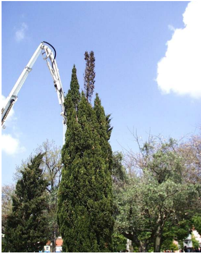
Fig. 2 – Intervenção para corte de ápice morto devido a Seiridium cardinale .