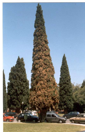
Fig. 7 - Acastanhamento e seca da folhagem devido a ataques de Cinara cupressi em Cupressus sempervirens .

De ressaltar que a sintomatologia causada pelos dois fungos pode ser confundida com os estragos resultantes dos ataques do afídeo Cinara cupressi Buckton que causa um amarelecimento generalizado da parte interior da copa dos ciprestes, levando à queda das folhas, sobretudo em anos em que a Primavera decorre quente e seca (Fig. 7). Este afídeo, uma das pragas mais importantes dos ciprestes, alimenta-se dos tecidos jovens dos ramos do interior da copa, produz abundantes quantidades de melada, promovendo assim a formação de fumagina sobre os órgãos afectados, e causa a seca e amarelecimento das folhas. Os estragos evoluem de modo acrópeto, podendo atingir toda a árvore. No caso do cancro, a seca e morte da folhagem ocorre num sector da copa e é sempre acompanhada pela formação de cancos e exsudação de resina, aspectos que não estão presentes no caso da praga. Os ataques de C. cupressi contribuem para debilitar as árvores pelo que, subsequentemente a uma infestação deste afídeo, é frequente assistir à instalação do cancro causado por S. cardinale ou por S. unicorn e (Fig. 8).