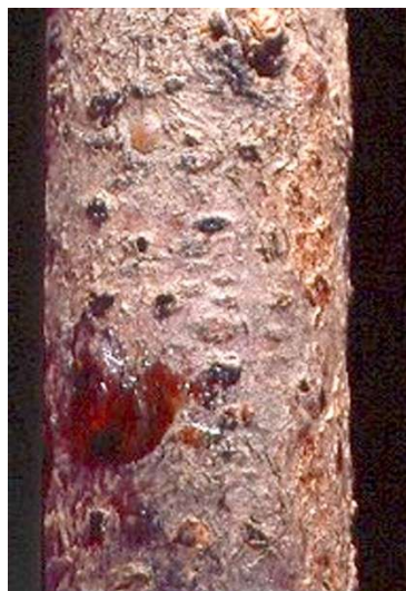
Fig. 6 - Frutificações de Seiridium cardinale no ritidoma.