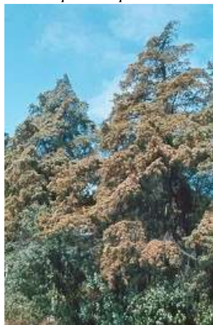
Fig. 8 - Seca da folhagem de Cupressus lusitanica num povoamento devida ao ataque simultâneo de Cinara cupressi e de Seiridium unicorn e.

A incidência do cancro cortical e a disseminação dos seus agentes causais são particularmente graves quando as condições climáticas são favoráveis à ocorrência da infecção e ao desenvolvimento da doença. Assim, a incidência da doença é maior em zonas onde ocorrem chuvas e períodos de humidade relativa elevada coincidentes com as épocas de frutificação do fungo e existência de novo inóculo (de Fevereiro a Junho e de Setembro a Novembro). Durante o Inverno, devido às baixas temperaturas, e especialmente no Verão, quando a humidade é baixa, assiste-se a uma redução da incidência e da evolução da doença. Apesar de a esporulação de S. cardinale ocorrer sobretudo na Primavera e no Outono, a disseminação dos conídios pode ter lugar durante todo o ano independentemente da temperatura e desde que haja