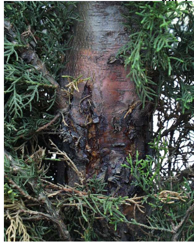
Fig. 3 - Cancro provocado por Seiridium cardinale com avermelhamento dos tecidos e escorrimentos de resina.